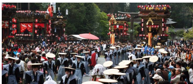
綿向神社 (日野祭より)