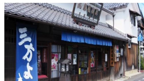
日野まちかど感応館