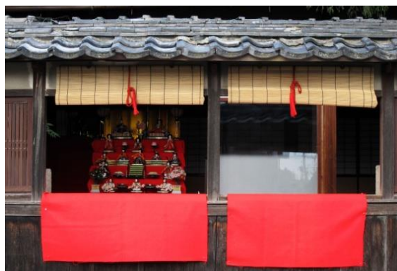
新町の街並み「棧敷窓」

岡本・南大窪町街並み→近江日野商人館→清水町街並み→若草清水→信楽院→本町街並み→綿向神社→新町の街並み (棧敷窓) →日野まちかど感応館 (旧正野玄三薬店)