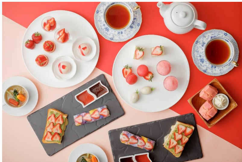
「河西いちご園×琵琶湖マリオットホテル」Strawberry Afternoon Tea」イメージ

場所：レストラン「 グリル ダイニング Grill & Dining G」(12階)