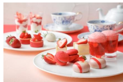
スイーツ イメージ

いちごのクロックムッシュ いちごの生春巻き いちごチリソース いちごバルサミコソース 牛コンソメを使った地元冬野菜のポトフ