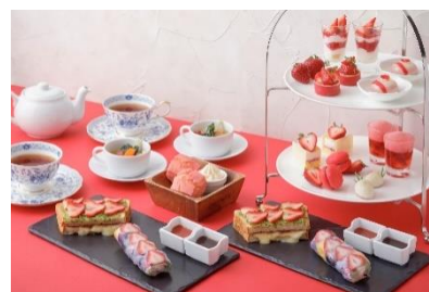
Strawberry Afternoon Tea イメージ

いちごのショートケーキ 近江レモンといちごのムース いちごタルト いちごとアドベリージュレ ホワイトチョコレートといちごのマカロン いちごのマドレーヌ いちごと練乳のブラマンジェ いちごスコーン いちごジャム クロテッドクリーム フレッシュな冬いちご