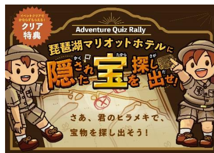
イベント イメージ