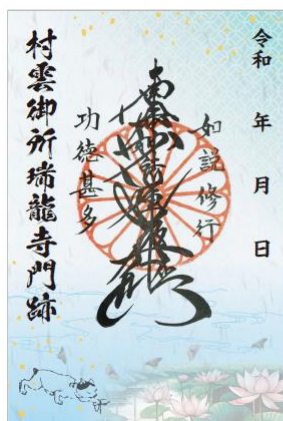
御朱印完成イメージ