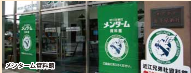
近江兄弟社本社1F(市内魚屋町29)入館無料・土日祝は休館