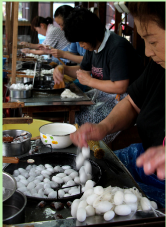
個平七条取り工房