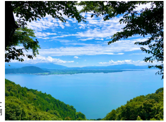
つづらお崎展望台から見た奥びわ湖