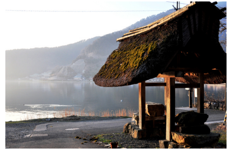
菅浦の湖岸集落景観(四足門)